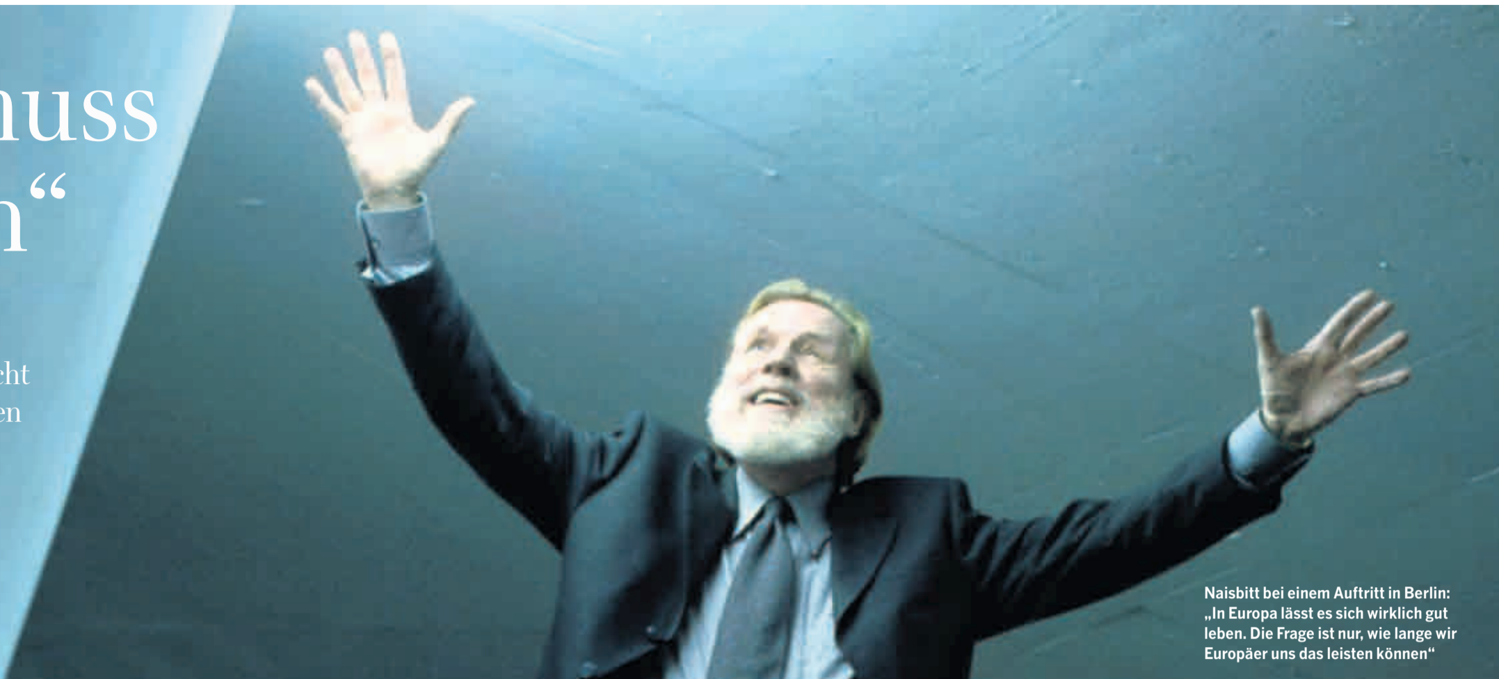
Naisbitt bei einem Auftritt in Berlin: „In Europa lässt es sich wirklich gut leben. Die Frage ist nur, wie lange wir Europäer uns das leisten können“

John Naisbitt hat den Begriff „Globalisierung“ geprägt. Jetzt macht sich der Zukunftsforscher Gedanken über das Schicksal Europas. Ein Gespräch über den unausweichlichen Fortschritt, reformunwillige Flugzeugbauer und Horrorszenarien der Klimaforscher